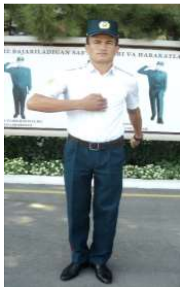
Қўл ҳаракати амаллари