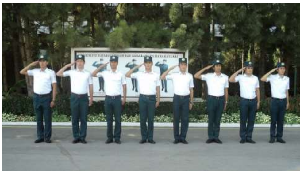
Бир шеренгали сафда туриб ҳарбийча салом бериш

Агар ҳарбий хизматчи бош кийим кийган бўлса, бундан ташқари, кафти ва бирлаштирилган бармоқлари тўғри узатилган ўнг қўлини, ўрта бармоқни чаккага теккизиб, елка чизиғи ва баландлигида кўтаради. Бошни бошлиқ(катта) томон буриш мобайнида чакка яқинидаги қўл ҳолати ўзгармас қолади.