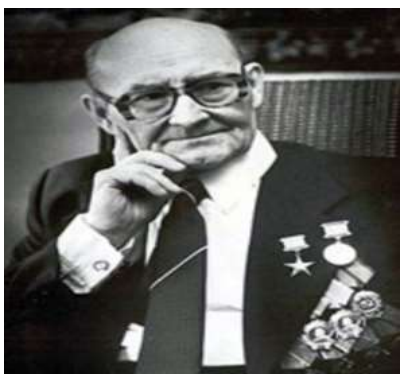
Николай Фёдорович Макаров (09.05.1914 - 13.05.1983)

1-ўқув саволи: Макаров пистолетнинг қўлланиш мақсади ва жанговар хусусиятлари