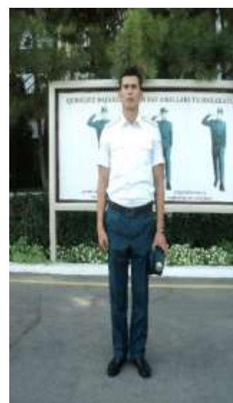
Бош кийимни ечиш

Бош кийимсиз ёки қурол «орқага» олинган ҳолатда бош кийим ўнг қўл билан, қурол «тасмага», «кўкракка» ва «оёққа» олинган ҳолатда чап қўл билан ечилиб, кийилади. Карабин «елкага» олинган ҳолатда бош кийим ечиладиган бўлса, карабин дастлаб «оёққа» ҳолатига келтирилади.