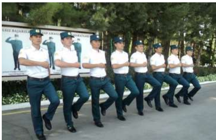
Жойида қадам босиш

Ушбу командага биноан жойда турган ҳолатда қадам босилиб, оёқ ердан 15 – 20 см.га кўтарилади. Бунда, оёқ кафти ерга учидан бошлаб босилади, қўл ҳаракати қадам вазнида бажарилади.