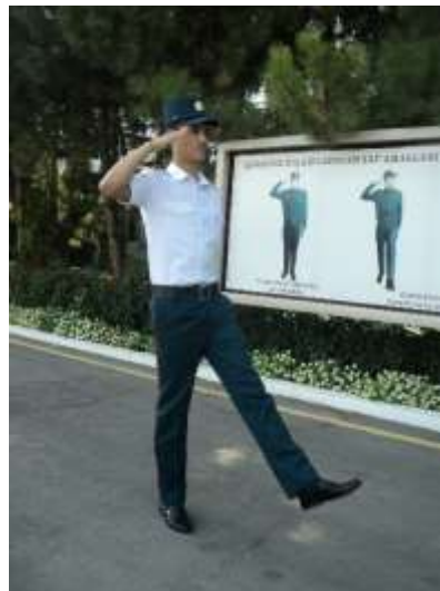
Юриш давомида ва жойда туриб ҳарбийча салом бериш

Сафдан ташқарида, бош кийимсиз, жойда туриб ҳарбийча салом бериш учун уч-тўрт қадамга яқин келган бошлиқ (катта) томон юзланиб, қад ростланади ва унинг юзига, бошни буриб борганча, қараб турилади.