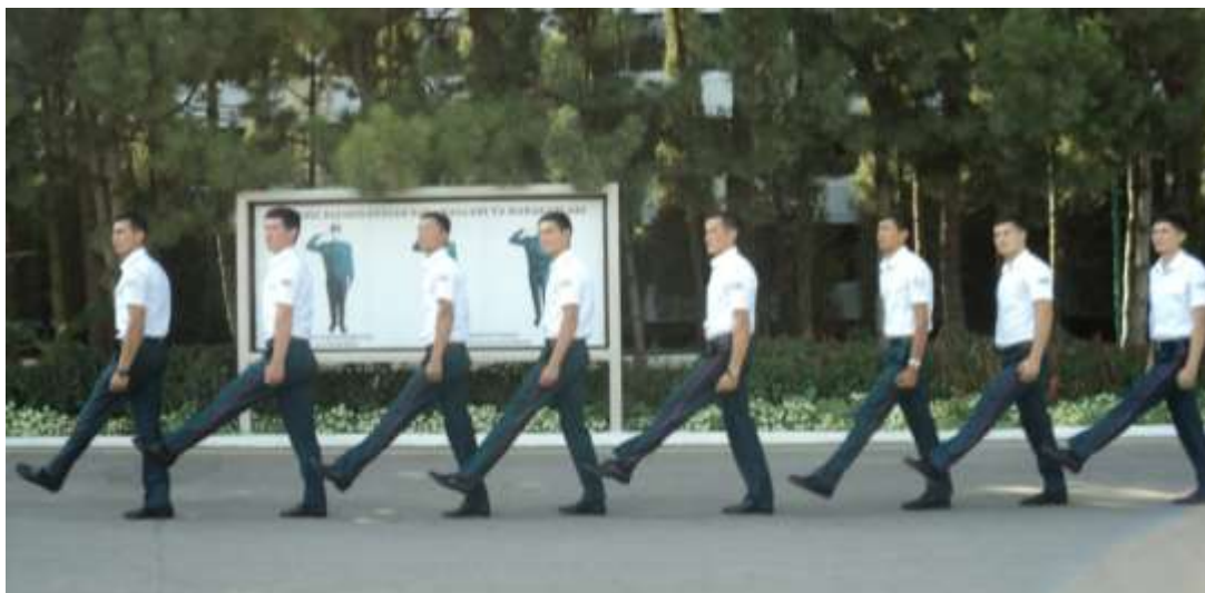
Бош кийимсиз юриш давомида ҳарбийча салом бериш

Сафдан ташқарида, бош кийимсиз юриш давомида ҳарбийча салом бериш учун қўл ҳаракати бошлиққа (каттага) уч-тўрт қадам қолганда навбатдаги қадам ташлаш баробарида тўхтатилади, бошни бошлиқ (катта) томон буриб, юзига қараганча, юриб борилади. Бошлиқнинг (каттанинг) ёнидан ўтгач, тўғрига қараб, қўл ҳаракати давом эттирилади.